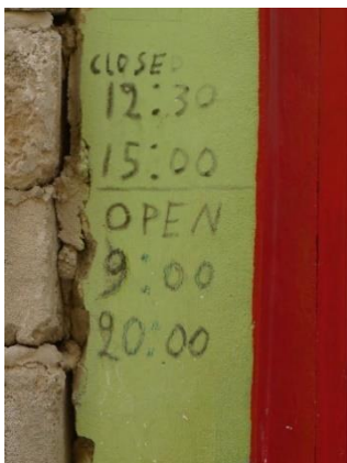
Bild: Aktuelle Öffnungszeiten dort, wo der Kunde sie sucht

Das Ziel von auskunft.de ist es, die Anbieter kontinuierlich zu entlasten und Schritt für Schritt unabhängiger von Google zu machen. „Je mehr wir als Suchmaschine den Unternehmen abnehmen, desto besser können sich diese auf ihr Kerngeschäft konzentrieren,“ betont der Bonner IT-Spezialist.